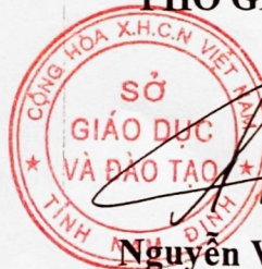
Nguyễn Văn Thuận